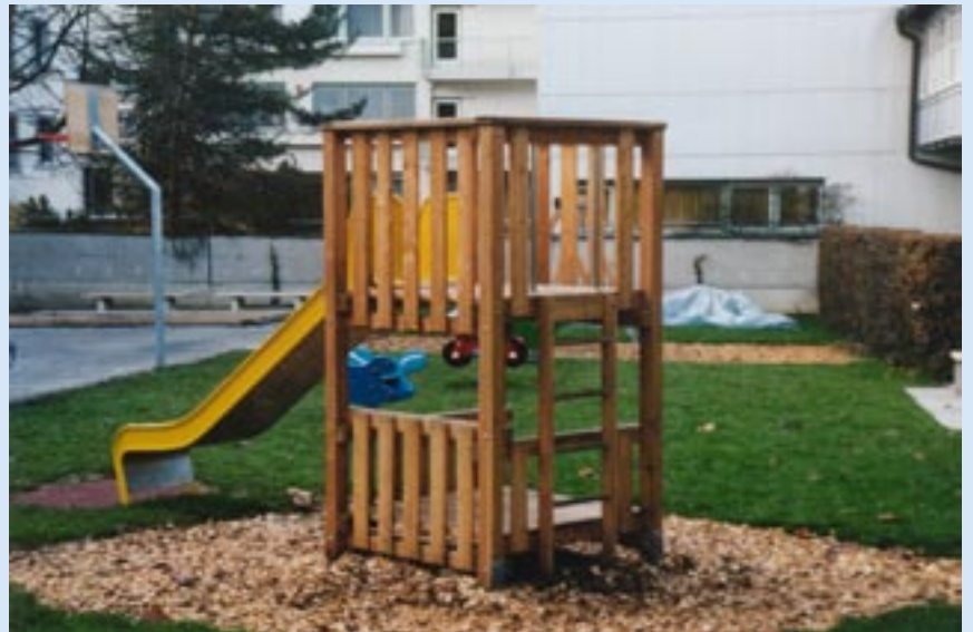
Spielturm, 125 x 125 cm

Unsere Spieltürme sind als universelle Spielgeräte verwendbar. Zwei Spielebenen geben bei den größeren Ausführungen zusätzlich Gestaltungs- und damit auch Spielmöglichkeiten. So kann die untere Spielfläche mit einer Brüstung versehen werden und bietet den Kindern Platz für verschiedene Rollenspiele.