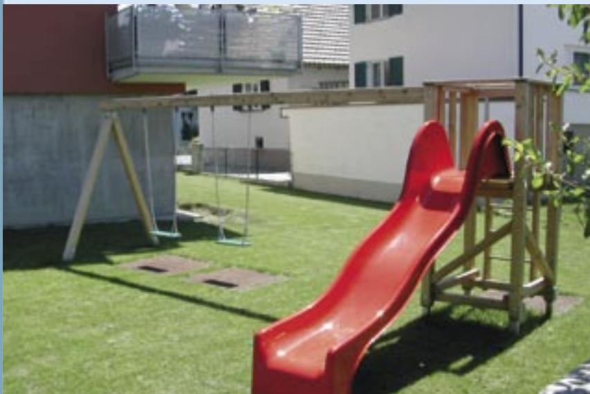
Spielturm, 90 x 90 cm