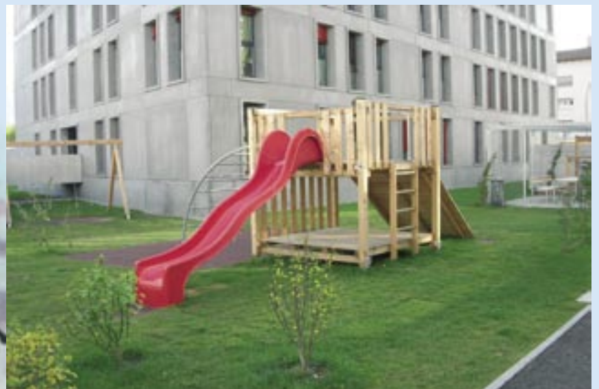
Spielturm, 190 x 190 cm