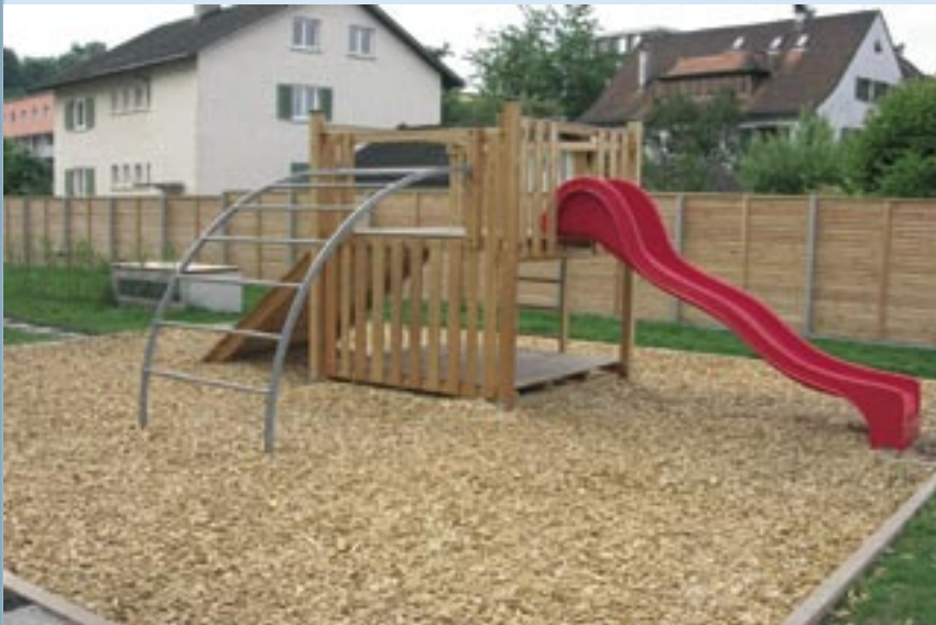
Spielturm, 190 x 190 cm

In drei Größen - vielseitig kombinierbar mit vielen Anbauteilen